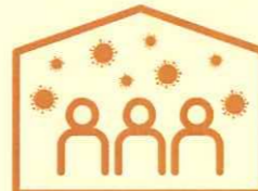
換気の悪い 密閉空間