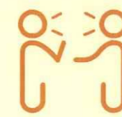
間近で会話や発声をする 密接場面