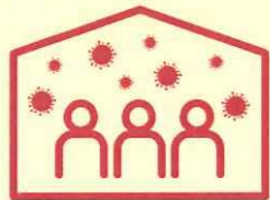
換気の悪い 密閉空間