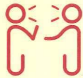
間近で会話や発声をする 密接場所