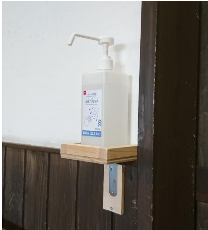
各部屋入口に消毒用アルコールを配置