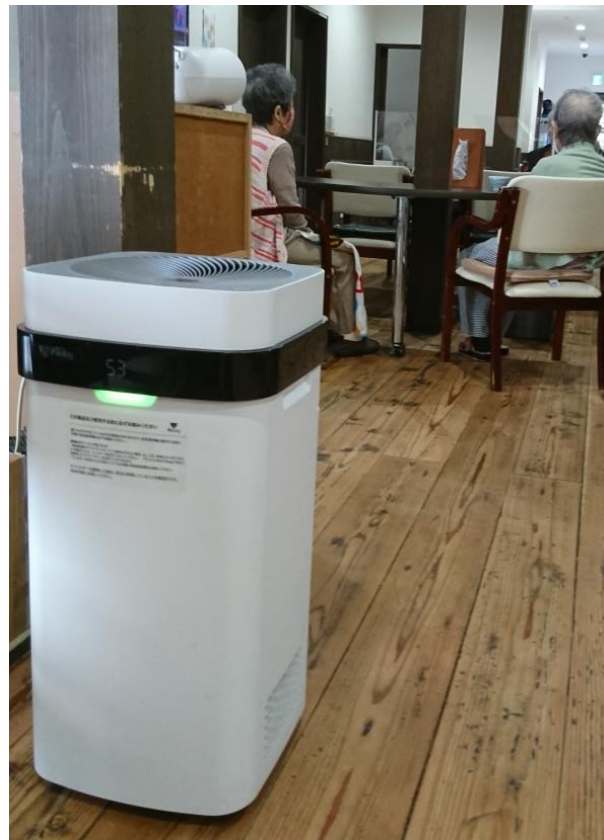
各室内に空気清浄機を設置