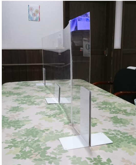
ご利用者様席にアクリルガードを設置