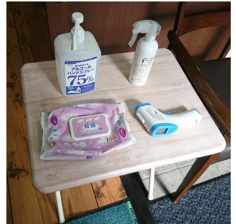
玄関に体温計・消毒用アルコールを設置