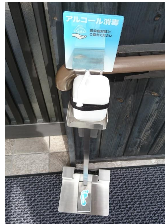
玄関前に消毒用アルコールを設置