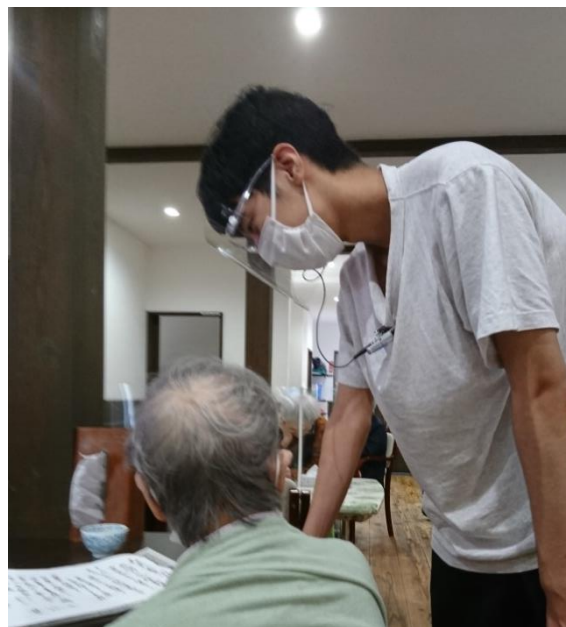
職員のフェイスガード着用を徹底